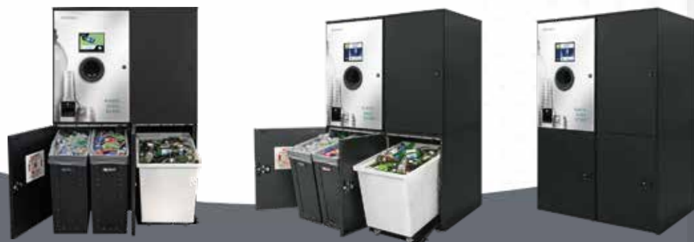
PLASTIC, DOZE ȘI STICLE